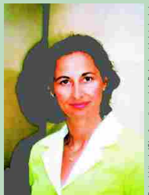
Ségolène ROYAL, Ministre déléguée à l'Enfance et aux familles

Un autre ministère, pendant ce temps, dort tranquillement sur les projets de réformes, pourtant vitales, du Droit de la Famille, après la fuite de sa Ministre, du ministère de la Justice vers celui de la Solidarité; aveu d'impuissance devant les blocages ou les pressions menaçantes des lobbies anti-père ou bien manque de détermination politique ?