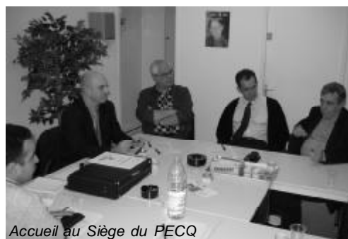
Accueil au Siège du PECQ